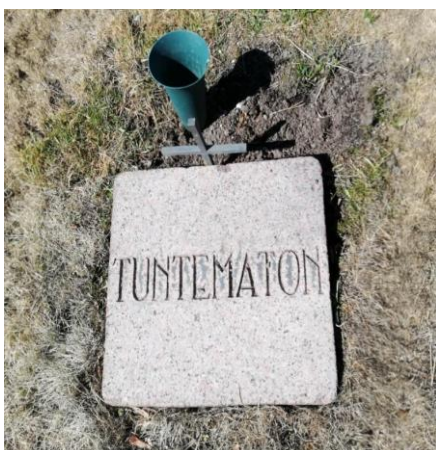
Tuntemattoman sotilaan hauta