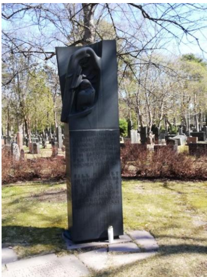
Menneitten sukupolvien muistomerkki