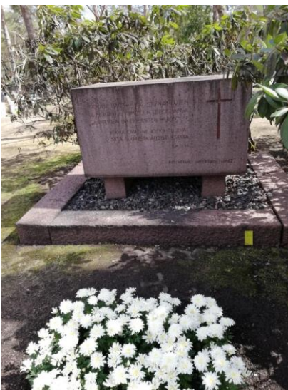
Inkeriläisten vainajien muistomerkki