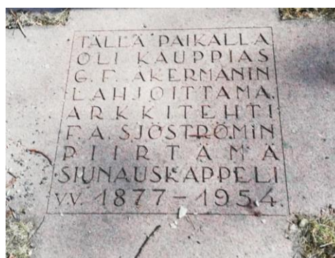
Menneiden sukupolvien muistomerkin paikalla oli hautausmaan ensimmäinen kappeli