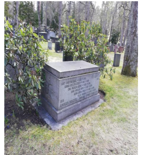
Aunuksen kävijäin muistomerkki