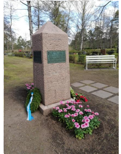
Työväenluokan veljeshauta 1918

Tutustutaan esimerkiksi menneiden sukupolvien veistokselliseen muistomerkkiin, sankarihautojen koskettavan kauniiseen yhteismuistomerkkiin ja punagraniittisiin veljeshautojen muistomerkkeihin. Näistä ja useista muista julkisista muistomerkeistä kuullaan toukokuisena iltapäivänä.