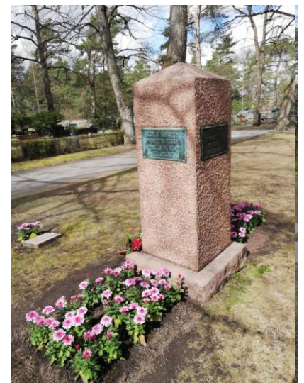
Punavankien joukkohautojen yhteismuistomerkki